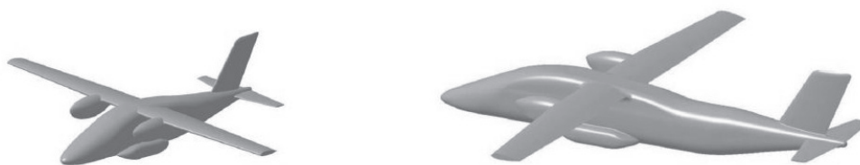
Рис. 2. Концепция семейства перспективных легких многоцелевых самолетов